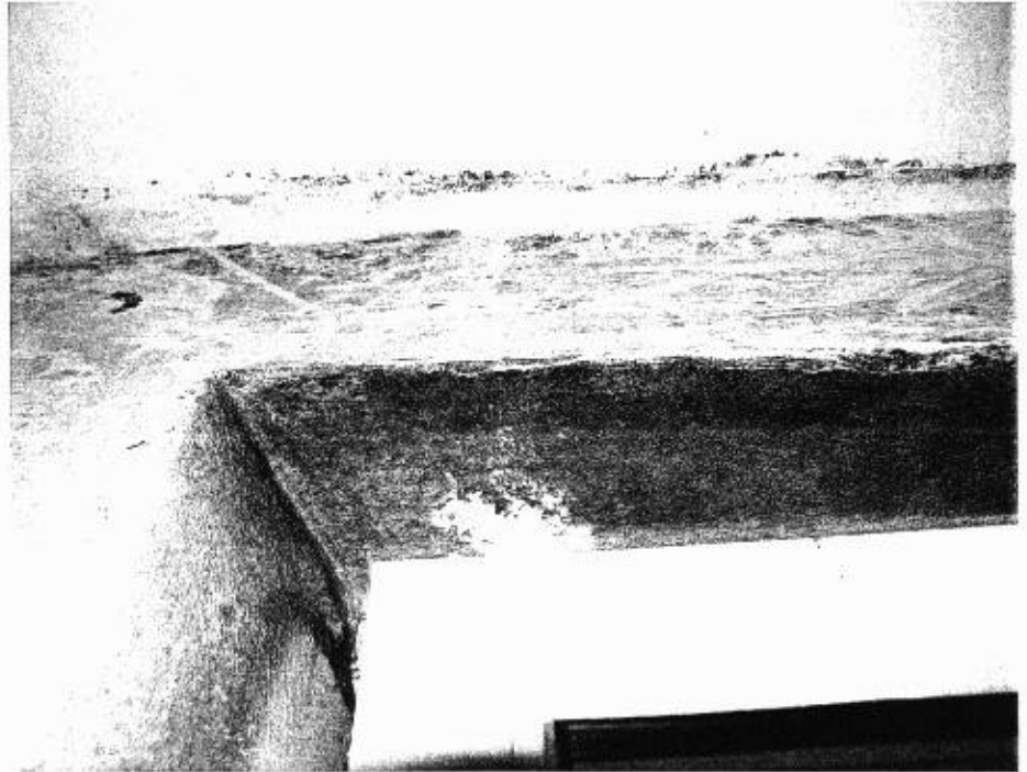
„Dauerkipper“: Typischer Schimmelbefall durch „Dauerkippen“ – Nutzerverhalten als Ursache für den Befall

Schimmel braucht zum Wachstum und zur Vermehrung: